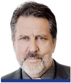
GARY JONES 국제학술위원회(ISC) 의장

2020년 5월 11일 부터 15일까지 5일간 대한민국 대구에서 개최 예정인 제17차 IWRA 세계물총회가 약 1년 앞으로 다가왔습니다.